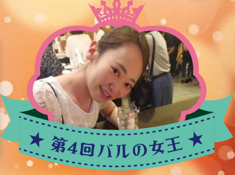
★ 第4回バルの女王 ★